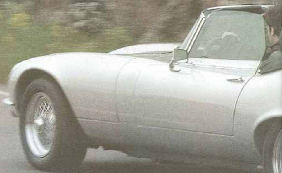
SISTE MODELL: 1974 CMC Serie 3 Jaguar E-Type 5.3 V12 OTS